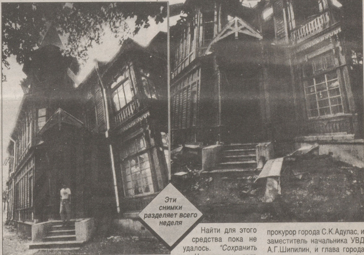
Эти снимки разделяет всего неделя

Кстати, утром 9 июля у пожарища были замечены и